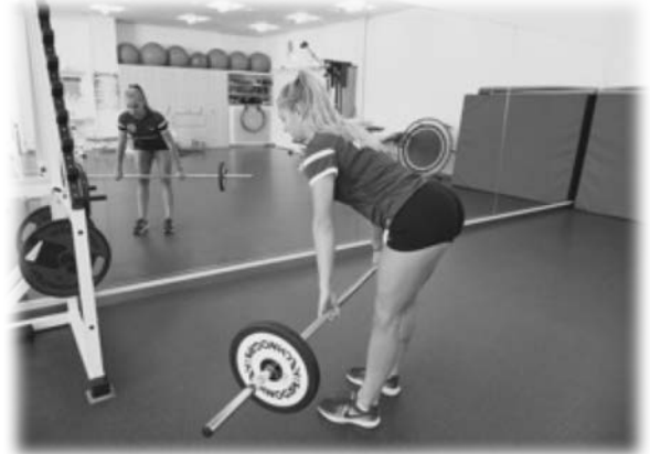
Stiffed Leg Dead Lift