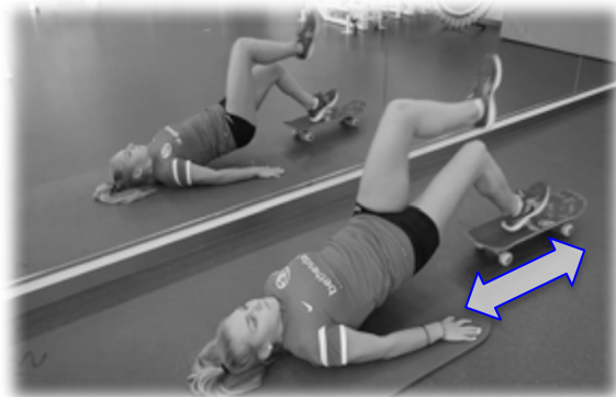
Hamstrings mit Skateboard