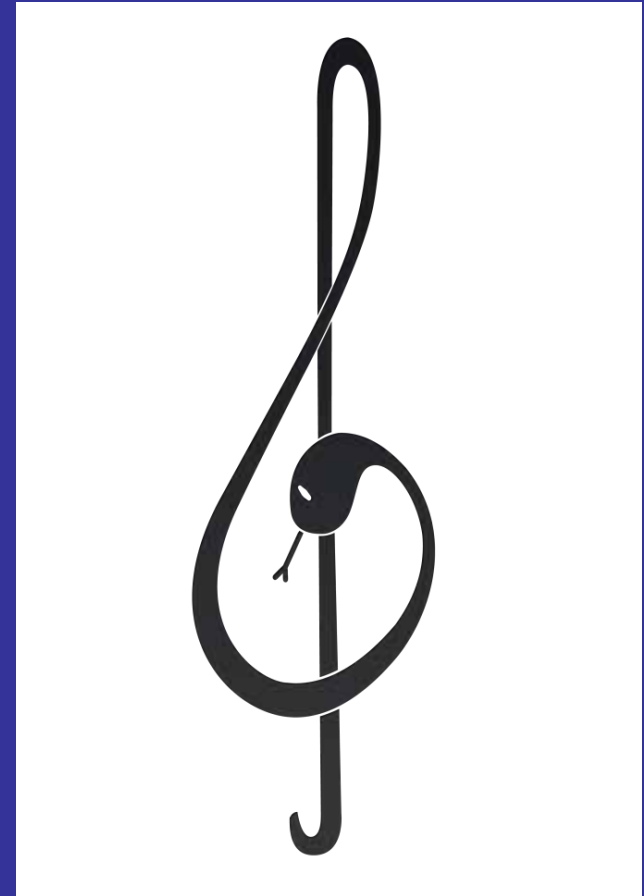
Logo: Stefanie Sch.